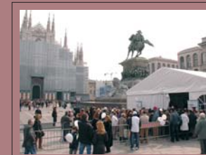
10 giornate di visite e consulti gratuiti per l'informazione e la prevenzione (cuore, stili di vita, diabete, pelle, allergie, dolore, respiro)