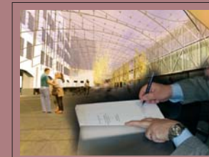
2008-2012 Nuovo Niguarda: firma e apertura del cantiere