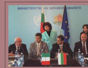
9 visite di delegazioni straniere e di rappresentanze istituzionali