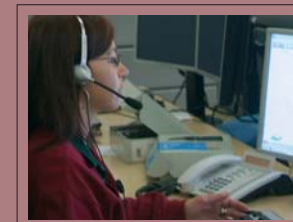
Niguarda a domicilio (ematologia, oncologia, pneumologia e telesorveglianza cardiologica)