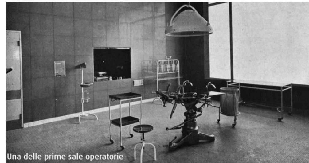
Una delle prime sale operatorie