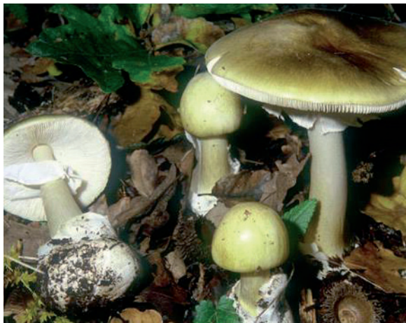
Amanita phalloides

Non esiste un antidoto in grado di combattere l'azione tossica dei funghi velenosi mortali!